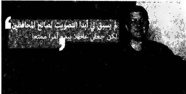
الشكل (9-2): الملصقات المقلدة المنسوبة لحزب المحافظين البريطاني